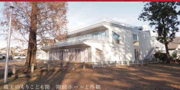
蔵王のもりこども園 階段ホールと外観