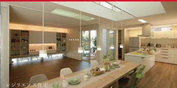
レジリエンス住宅